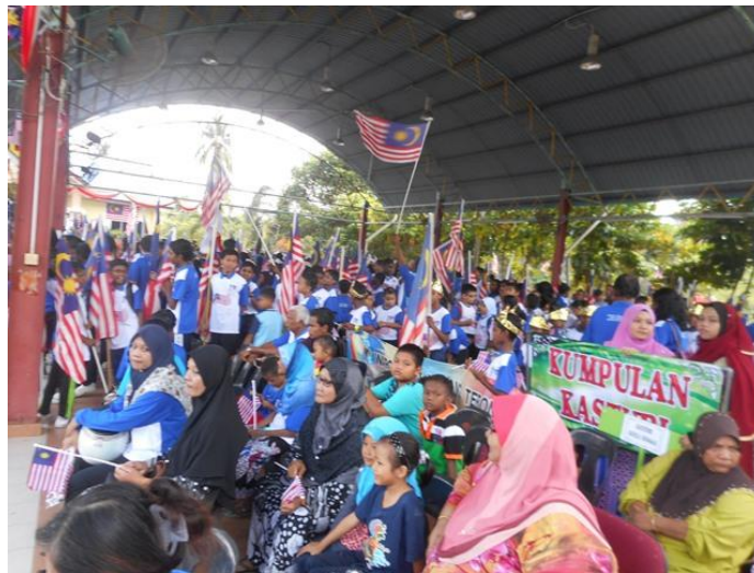
Pengunjung yang hadir semasa program berlangsung.