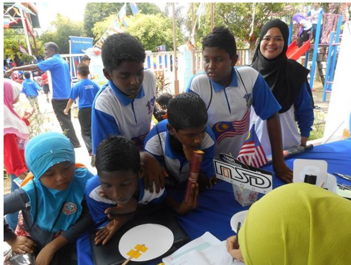
Sesi pendaftaran Komuniti Kuala Sungga di meja pendaftaran P11M.