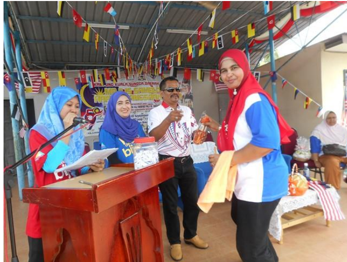
Acara cabutan bertuah kepada pengunjung bertuah.