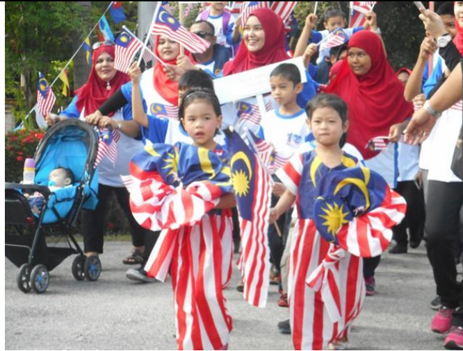
Acara Perarakan dari persatuan dan wakil yang terlibat.