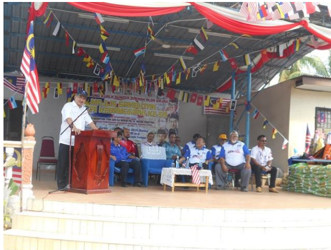
Perasmian dari Datuk Seri Ali Rustam.